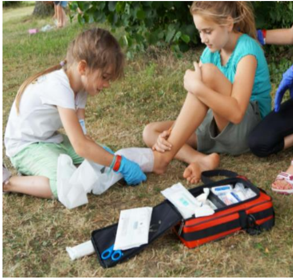
01 Erste Hilfe im Sport